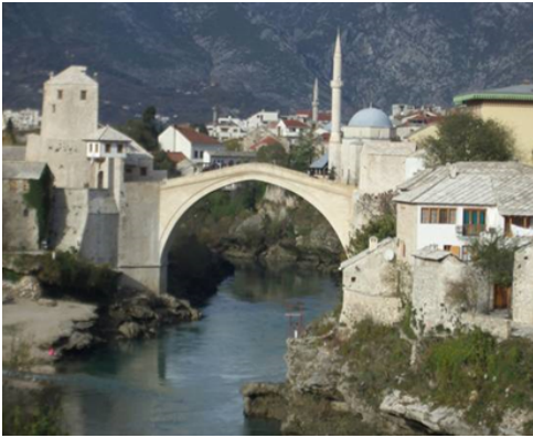
Die Brücke von Mostar

Das United World College (UWC) in Mostar bietet zwei Praktikantenstellen für LehramtsstudentInnen pro Halbjahr an.