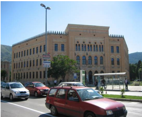
Das United World College in Mostar

EasyGo- Easy Come übernimmt die Vermittlung der Praktikumsstellen, den Auswahlprozess sowie die inhaltliche und organisatorische Betreuung der Praktikanten.